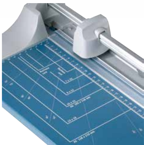
Praktyczne linie formatu ułatwiają ułożenie ciętego materiału