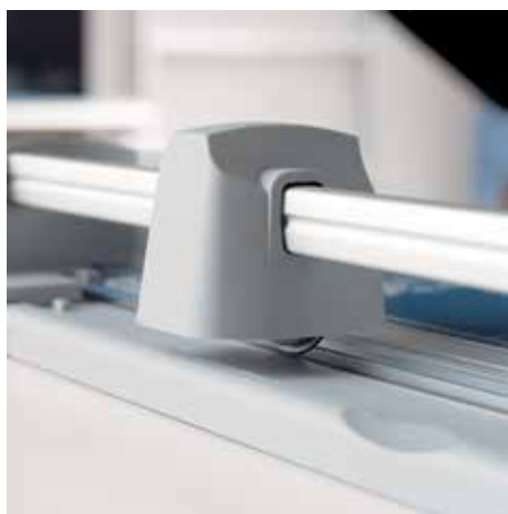
Bezpieczne cięcie dzięki zabezpieczeniu ostrza