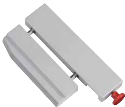
Precyzyjny mechanizm do cięcia wąskich pasków - dostępny opcjonalnie