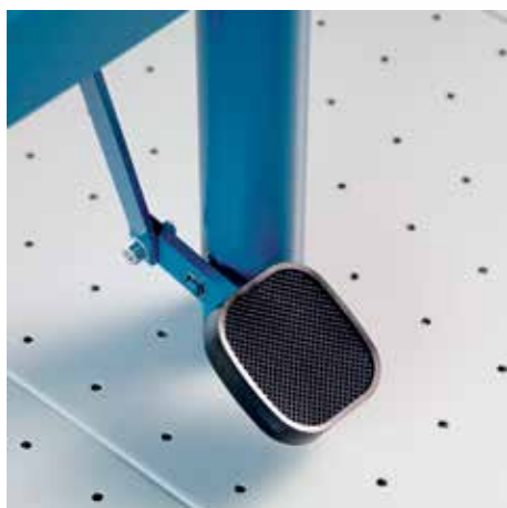
Wygodny docisk nożny dla bezpiecznego przytrzymywania dużych formatów