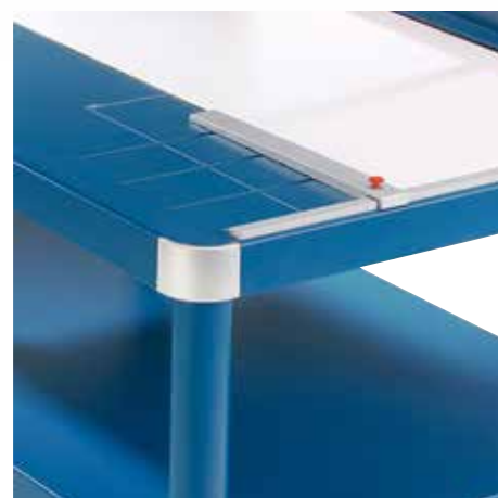
Regulowany metalowy ogranicznik tylny do szybkiego dopasowania formatu - może być mocowany na obu listwach i na przednim blacie