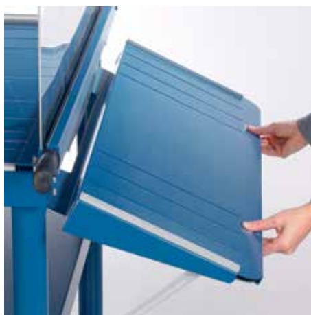
Składany stół przedni do cięcia dużych formatów