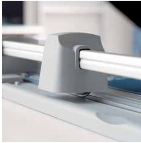
Bezpieczne cięcie dzięki zabezpieczeniu ostrza