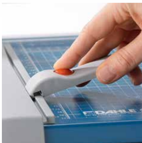
Regulowany ogranicznik tylny do szybkiego dopasowania formatu - może być mocowany na obu listwach