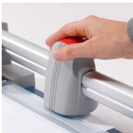
Ergonomiczna głowica zapewnia wygodne cięcie