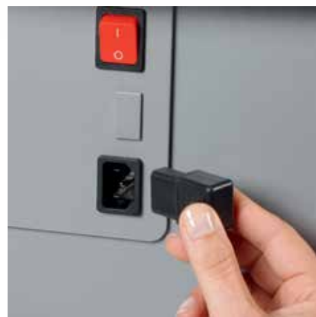
Wymowana wtyczka zasilania sprawia że łatwo przenieść niszczarkę z punktu A do punktu B