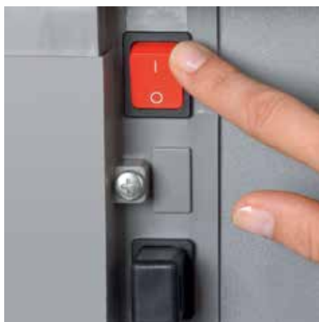
Oddzielny główny wyłącznik jest ulokowany w tylnej części niszczarki i całkowicie odcina ją od prądu