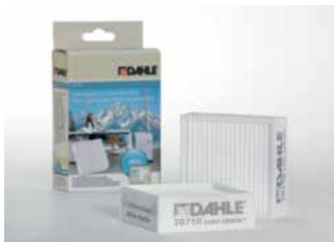
Niszczarki dokumentów Dahle