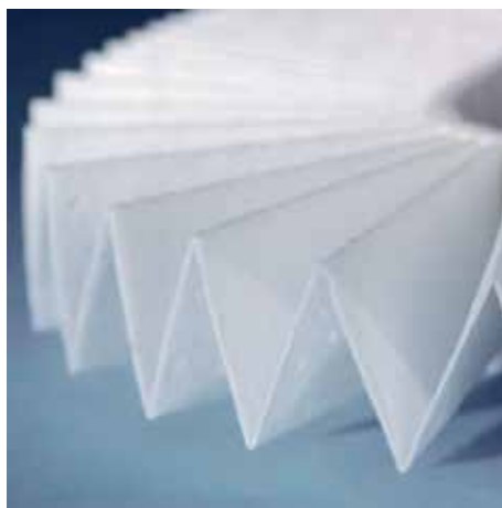
Przyjazny dla środowiska filtr stworzony ze specjalnej trzywarstwowej włókny nadającej się do recyklingu