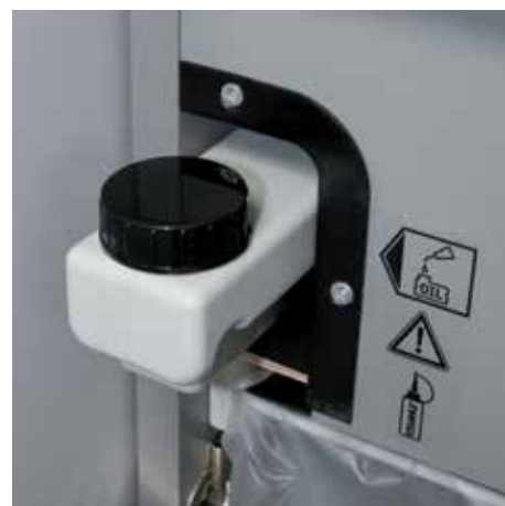
Zintegrowany automatyczny podajnik oleju do automatycznego olejowania cylindrów tnących pomaga wydłużyć ich żywotność