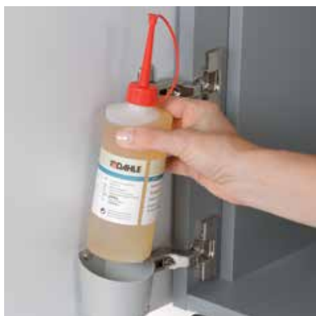
Przyjazny dla środowiska olej jest zawsze w zasięgu ręki, dołączony do wszystkich modeli produkujących ścinki