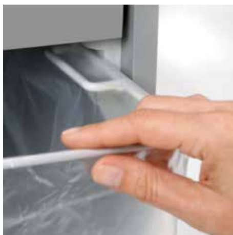
Wyciągnij zaokrągloną górną ramkę kiedy wymieniasz worek na ścinki