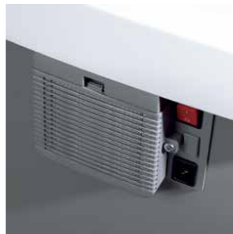
Unikalny system filtrów DAHLE CleanTEC® efektywnie wytępuje mikropyłki dbając o czyste powietrze w biurze.