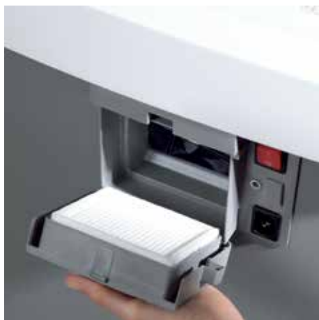
Przyjazny dla środowiska filtr jest łatwy do wymiany. Ikona na panelu kontrolnym wskazuje kiedy należy go wymienić