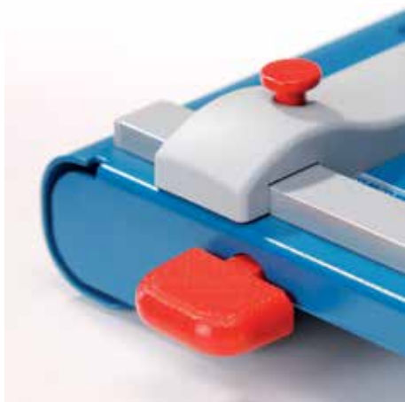
Automatyczny, możliwy do wyłączenia docisk, ułatwia pracę przy cięciu delikatnych materiałów