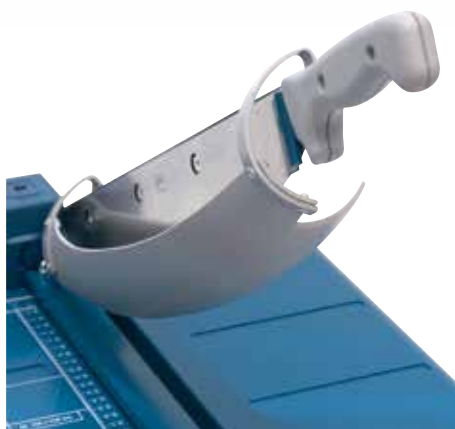
Automatyczna osłona ostrza zapewnia pewną ochronę i nie zasłania widoku na linię cięcia